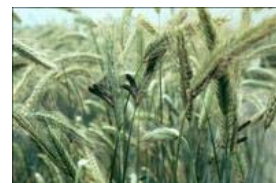
Meldrøgersvampen angriber rugens blomster og kerneanlæggene omdannes til lange, mørke legemer, der er giftige.

Vinterrug til brød gødskes som anden vinterrug. Ved kørsel i marken bør det så vidt muligt tilstræbes at undgå beskadigelser af afgrøden, da beskadigelser og sent udviklede planter med en heraf følgende forsinket blomstring kan øge risikoen for angreb af meldrøjer. Det gør sig f.eks. gældende ved udbringning af gylle. Ved at