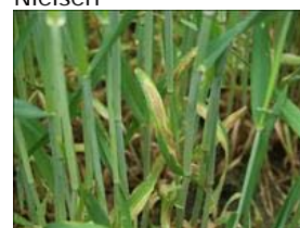
Skoldplet i rug.