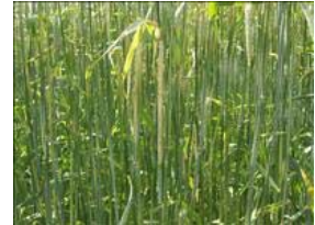
Brune bladskeder som følge af tripsangreb.

Trips anbefales bekæmpet ved en mørk trips pr. bladskede. Det er vigtigt at evt. bekæmpelse udføres lige før begyndende skridning. Da tripsene sidder inde i bladskederne, tager det tid at undersøge marken. Godkendte pyrethroider kan anvendes.