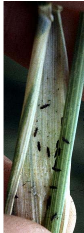
Trips inde i bladskeden.