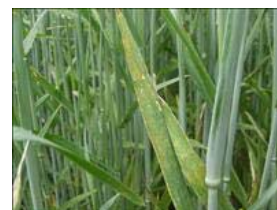
Brunrust i rug.

Brunrust bekæmpes, hvis der er over 10 procent angrebne planter. Brunrust er den mest tabsgivende svampesygdom i rug, og selv ret sene angreb kan være tabsvoldende. Det er derfor vigtigt at vurdere behovet for en evt. sen bekæmpelse af brunrust omkring 1. juni.